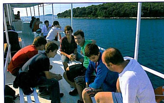
Hlavní náplní pátečního dne byl celodenní výlet lodí podél pobřeží Istrije ze Zelené Laguny u Poreče do historického města Rovinj.