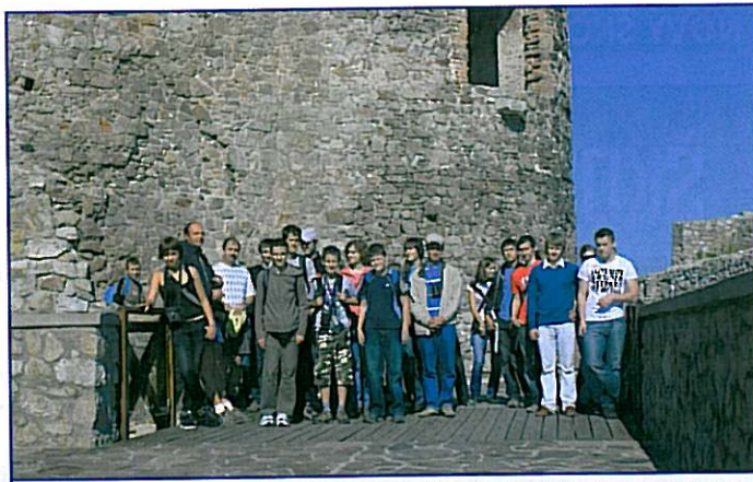
Skupinové foto účastníků expedice v areálu zříceniny hradu Devín nad soutokem řek Moravy a Dunaje.