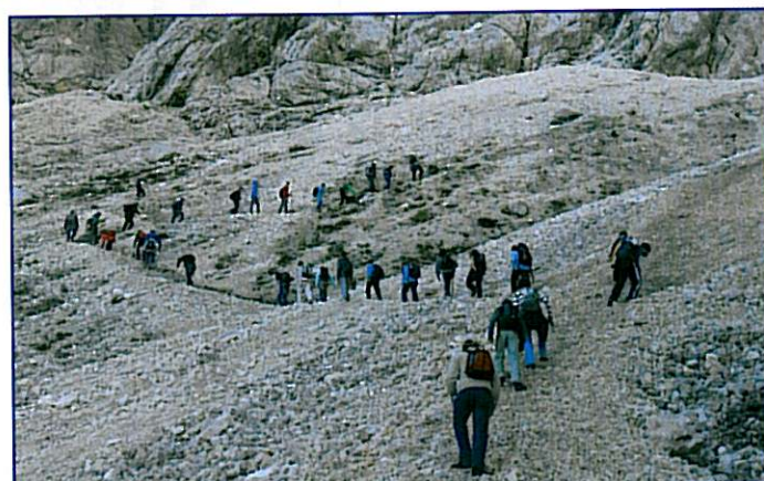
Účastníci expedice při závěrečné části výstupu do sedla Luknja. Trasa vedla údolím Vrata pod severní stěnou nejvyšší slovinské hory Triglavu (2 865 m n. m.).