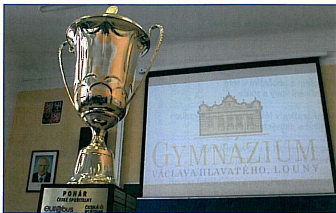
Putovní Pohár České spořitelny je pro letošní ročník v držení Gymnázia V. Hlavatého v Lounech. Dosud se žádná škola nepodařilo zvítězit ve dvou ročnících za sebou.