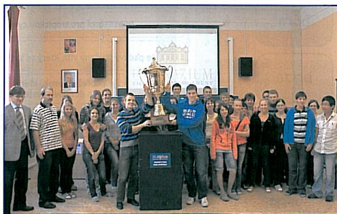
Studenti lounského gymnázia, kteří se nejvíce zasloužili o prvenství v Soutěži škol v loňském 15. ročníku soutěže Eurorebus.

CO NEJVĚŠÍ POČET ZAPOJENÝCH ŠKOLNÍCH TŘÍD JE ZÁRUKOU ÚSPĚCHU ŠKOLY V SOUTĚŽI EUROREBUS !!! ÚČAST V SOUTĚŽI EUROREBUS SE VYPLATÍ !!!