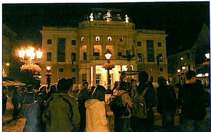
Účastníci E.ON Expedice Eurorebus 2010 před Slovenským národním divadlem při noční prohlídce historického centra Bratislavy.