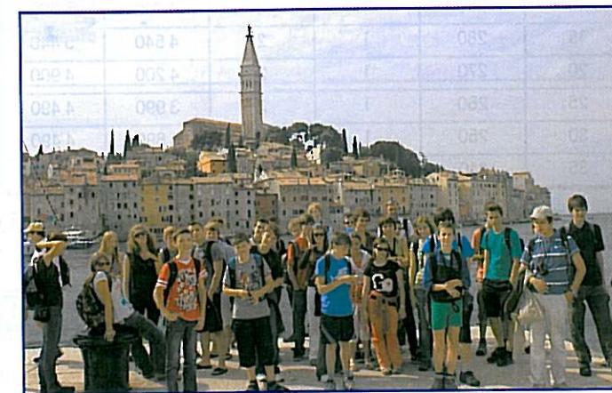
Skupinové foto po příjezdu do starobylého města Rovinj. V pozadí vidíme dominantu města – kostel sv. Eufemie z 18. století.