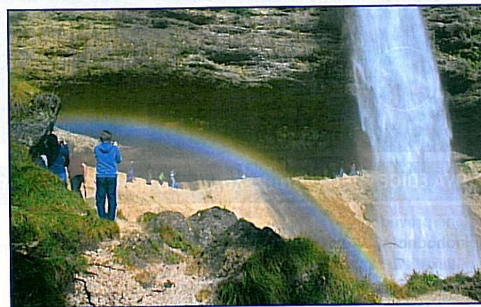
Součástí expedice byla i procházka k vodopádu Peričnik, který je mnohými považován za nejkrásnější vodopád ve slovinských Julských Alpách.